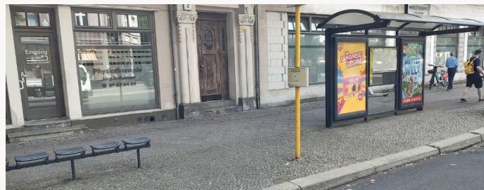
Vor (oben) und nach (unten) meiner Nachfrage bei der BVG

Ich habe bei der BVG nachgehakt und tatsächlich scheint die Bank im Häuschen schlicht vergessen worden zu sein. Ich bin sehr froh, dass die BVG umgehend reagiert und zügig eine Bank im Häuschen aufgestellt hat. Jetzt können endlich alle, die auf ihren Bus warten müssen, im Trockenen sitzen.