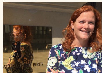
Vor dem Abgeordnetenhaus

Nach der Sommerpause stehen für uns Abgeordnete ab September die Verhandlungen über den Doppelhaushalt der Jahre 2024 und 2025 an. Dabei stellen wir das Geld für unsere Schwerpunkte zur Verfügung, denn wo kein Geld, da keine Umsetzung. Deshalb werde ich mich als gesundheitspolitische Sprecherin in den Verhandlungen vor allem für mehr Mittel für die Versorgung von Long-COVID Patienten einsetzen, aber auch für eine bessere Ausstattung unserer Rettungstellen.